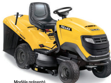
Modèle présenté TG 190/102 HS Bi