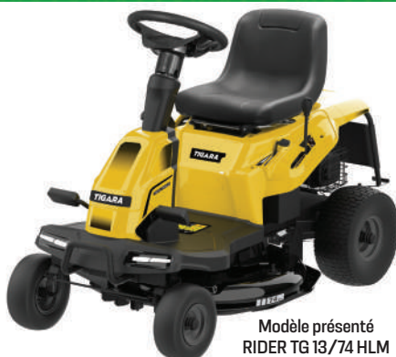
Modèle présenté RIDER TG 13/74 HLM

Moteur LONCIN. Carter acier. Démarrage électrique. Transmission hydrostatique