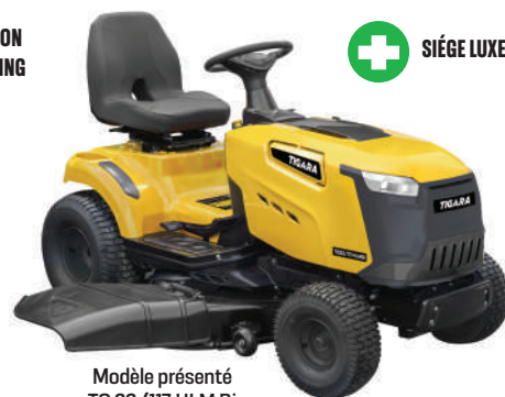
Modèle présenté TG 22/117 HLM Bi