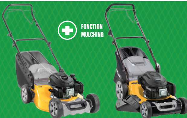
Modèle présenté TG 48 TS

Diamètre roues sur roulement à billes 200/280 mm. Réglage hauteur de coupe centralisé 6 positions. Guidon ergonomique. Grandes roues.