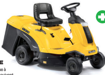
Modèle présenté RIDER TG 130/72 H